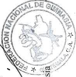
Representante Legal VIP Security, Sociedad Anónima